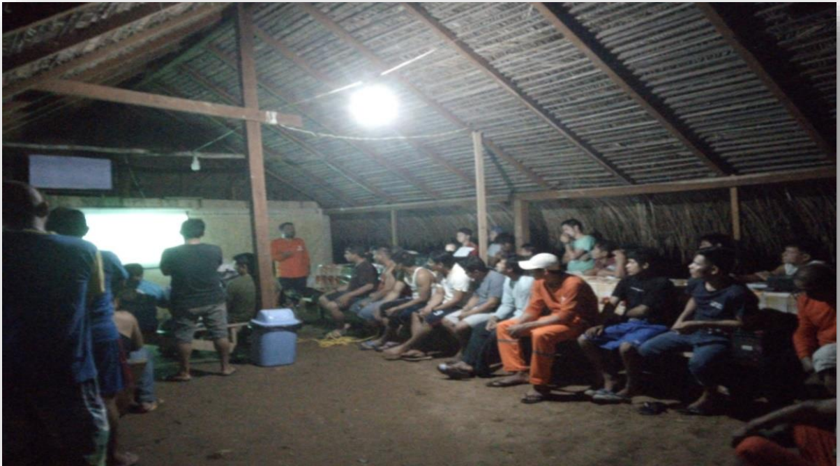
FOTOGRAFIA N° 01: Capacitación en campamento