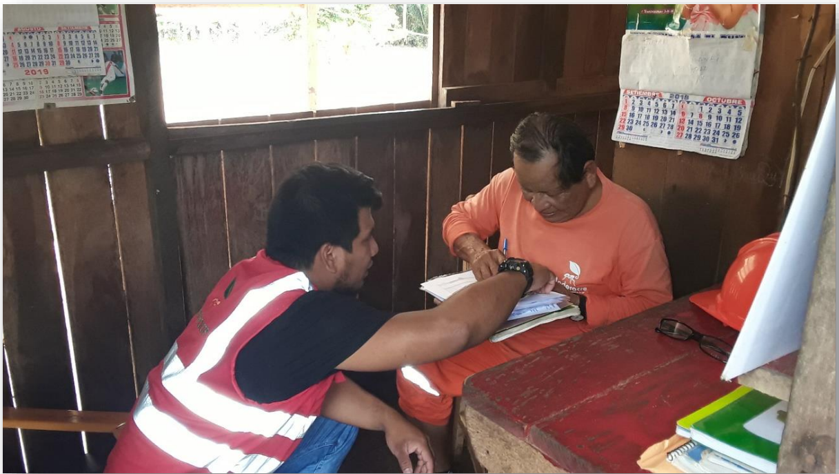
FOTOGRAFIA N° 02: Capacitación en Garita de Control