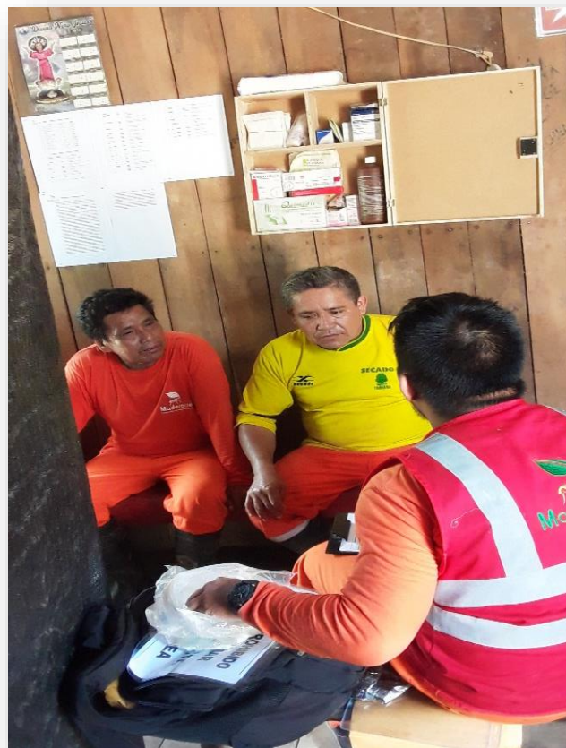
FOTOGRAFIA N° 04: Capacitación en uso de botiquín